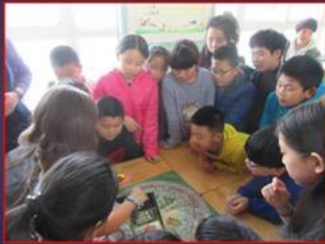
Escuela AOMAUH Ningbo, China