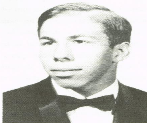
Steve Wozniak, fotografía del anuario escolar de 1968, su último año de secundaria.